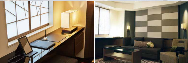
プレミアムエグゼクティブセミスイートルーム Premium Executive Semi-Suite Room