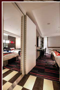
スーベリアルーム (コネクティング) Superior Room (Connecting room)