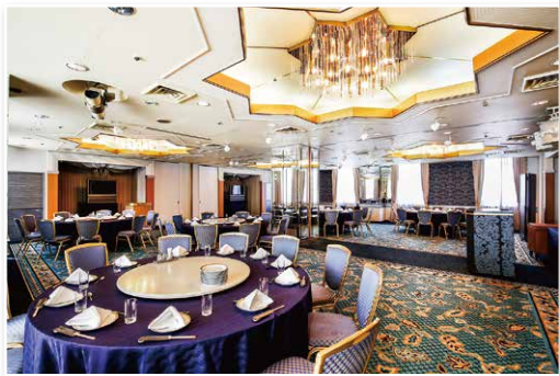
おおとり(ロビー階) Otori (Lobby floor)