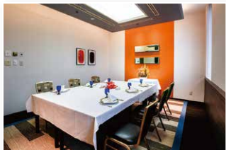
チャタベース(ロビー階) Chatter Base (Lobby floor)