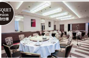
スペースシャトル(ロビー階) SPACE SHUTTLE (Lobby floor)