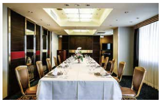
さく(4階) Kiku (The 4th floor)