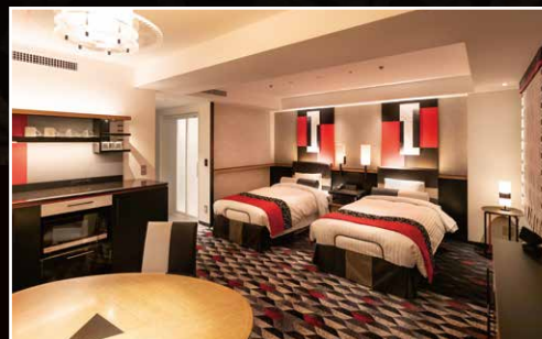
プレミアムハートフルルーム (ツイン) Premium Heartful Room (Twin)

Find just the right room to relax and wake up feeling refreshed thanks to the perfect combination of business functionality and refined, metropolitan hospitality.