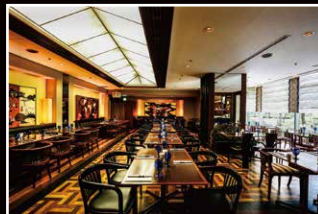
レストラン舟茶屋(ロビー階) Restaurant FUNACHAYA (Lobby floor)