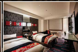
スーベリアルーム (ツイン) Superior Room (Twin)