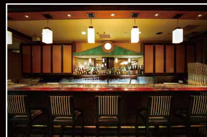
バー アウトリガー(ロビー階) Bar OUTRIGGER (Lobby floor)