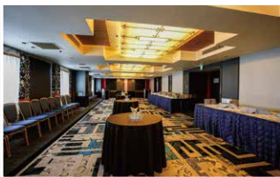
相生(4階) Aoi (The 4th floor)

Whether for business or a personal milestone, allow our incredible cuisine and hospitality help you create an unforgettable occasion for your honored guests.