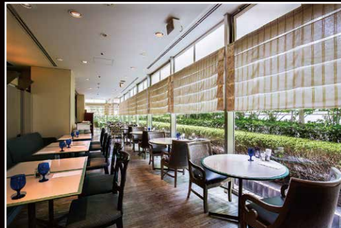
ザ・ラウンジ(ロビー階) The Lounge (Lobby floor)

If you aren't in the mood for a meal, simply unwind at our elegant lounge and bar. No matter where you drink or dine, our luxurious atmosphere, refined decor and meticulous service are sure to make your stay more memorable.