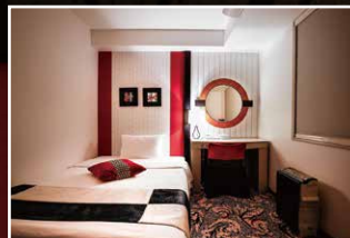
クオリティールーム (シングル) Quality Room (Single)