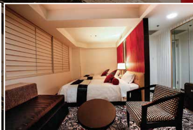
エグゼクティブデラックスルーム (ツイン) Executive Deluxe Room (Twin)